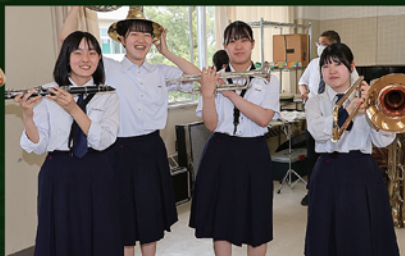
石川県立鹿西高校 吹奏楽部

【主催】 鵜様道中の宿保存会 https://usama-doucyu-noyado.com/