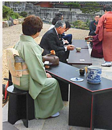
※上の写真はイメージです。当日のお茶会は屋内で行います。